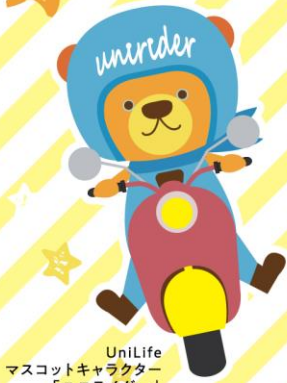
UniLife マスコットキャラクター 「ユニライダー」